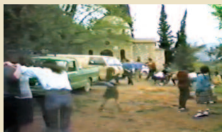
Πάσχα 1983 στους Ανδρονιάνους

Στους μικρούς τόπους, εκεί όπου οι άνθρωποι κρατούν ζωντανή τη μνήμη και την παράδοση, τα ήθη και τα έθιμα αποτελούν πολύτιμο κομμάτι της ταυτότητας του τόπου. Από γενιά σε γενιά, οι συνήθειες αυτές συνεχίζουν να μας ενώνουν, να μας θυμίζουν τις ρίζες μας και να δίνουν ξεχωριστό χρώμα στις γιορτές και την καθημερινότητά μας.